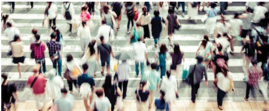
En el portal de Universia se contabilizan más de 9.000 títulos para graduados que se pueden realizar en nuestro país.

En los últimos años se ha incrementado exponencialmente la oferta de másteres especializados en ámbitos tan dispares como los videojuegos o la nanotecnología. Sin embargo, el mercado laboral no desdeña perfiles con una formación más genérica y transversal