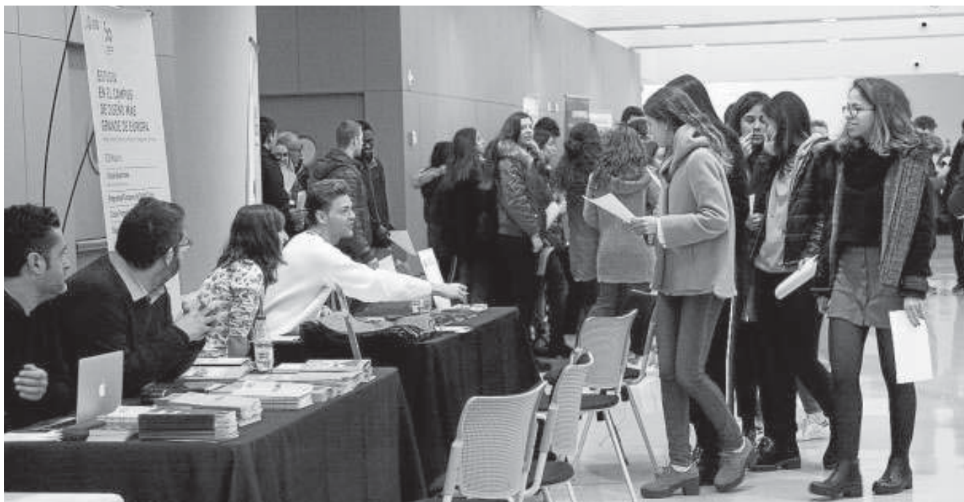
Titulaciones, precios de matriculación o becas fueron algunas de las dudas más consultadas en Unitour.