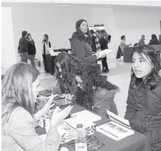
Instante en el que los jóvenes recibían ayer información personalizada.

práctica lección para no desviarse de su trayecto académico, ni adentrarse en arenas movedizas de las que luego arrepentirse.